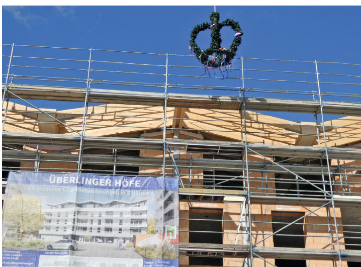
Die Richtkrone schwebt über dem Neubau