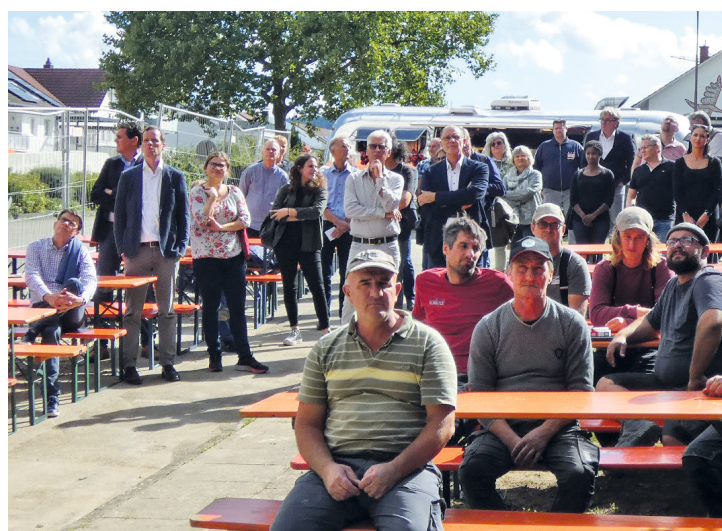
Viele interessierte Zuhörer beim Richtfest