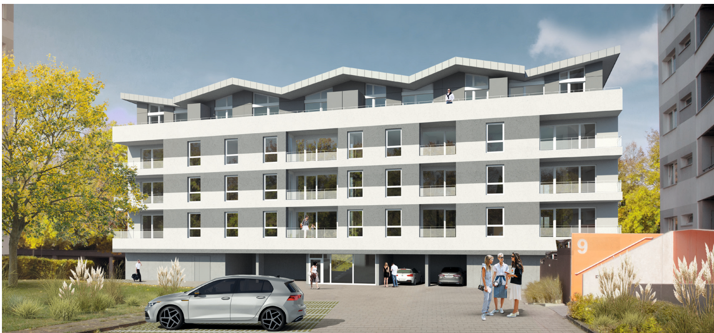
Visualisierung der Überlinger Höfe